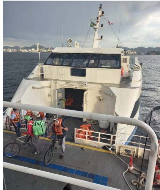
Figura 2 – Pax realizando transbordo