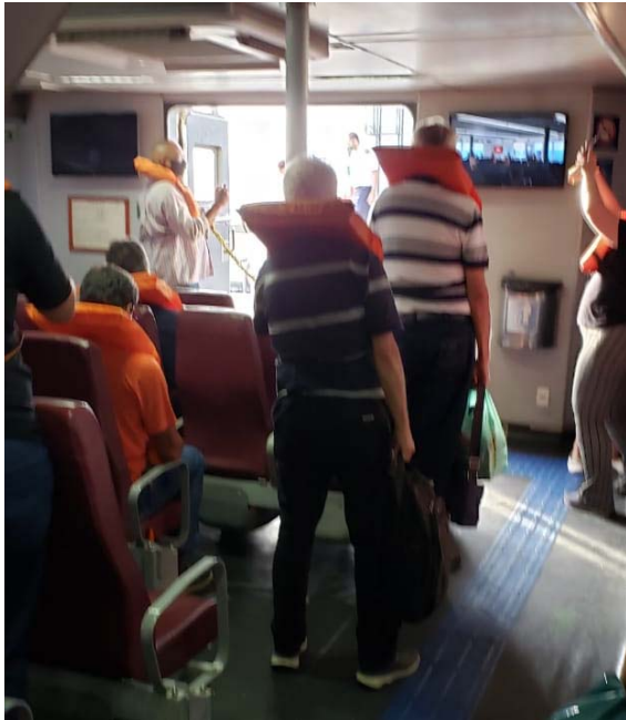
Figura 1 – Preparação do transbordo